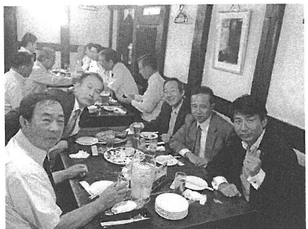
例会後懇親会（於：壱之倉庫）