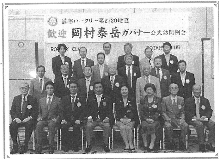
岡村泰岳ガバナー公式訪問 集合写真