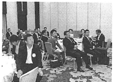
熊本グリーン・熊本北RC合同 ガバナー公式訪問風景