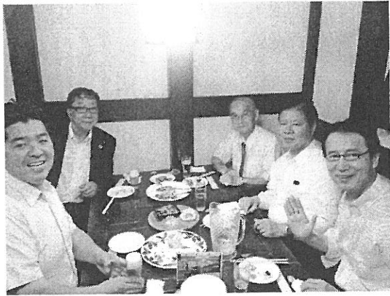
合同懇親会の様子