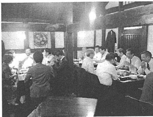
大勢参加の懇親会でした