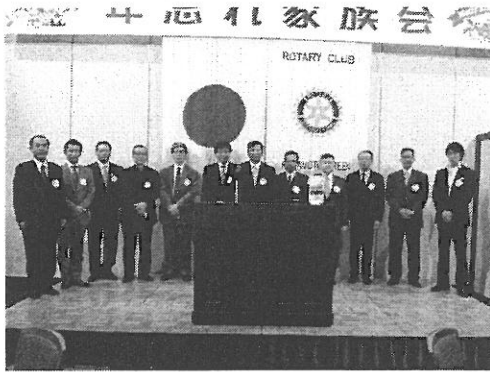
年次総会 次年度役員の皆様