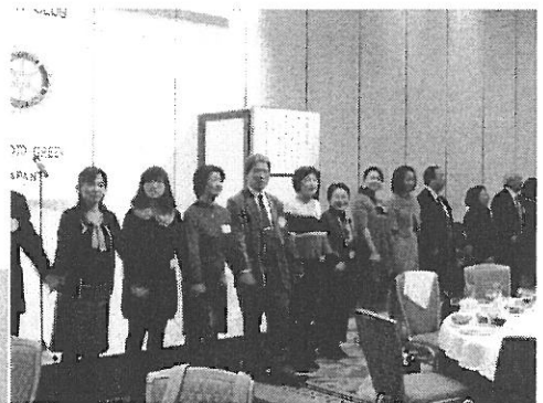
最後は皆で輪になって 「手に手つないで」