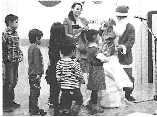
サンタさんから子供達にプレゼント

前菜彩々 紋甲イカとユリ根ミルク炒め 生ガキと銀杏の辛し炒め 海の幸入りフカヒレスープ 豚肉のとろとろ煮 大エビのチリソース 牛肉の中華丼 古典式アンニンドーフ