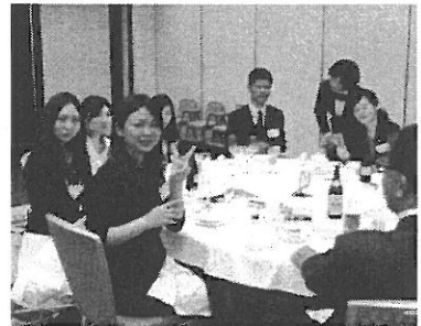
今年はアクトの皆様にも 御参加頂きました