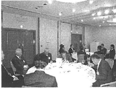
クラブフォーラムの様子