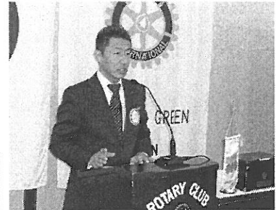
会長による趣旨説明