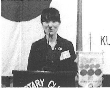
「ローターアクト研修会」の協力御礼