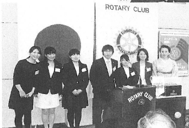
熊本グリーンRAC の参加者の皆さん