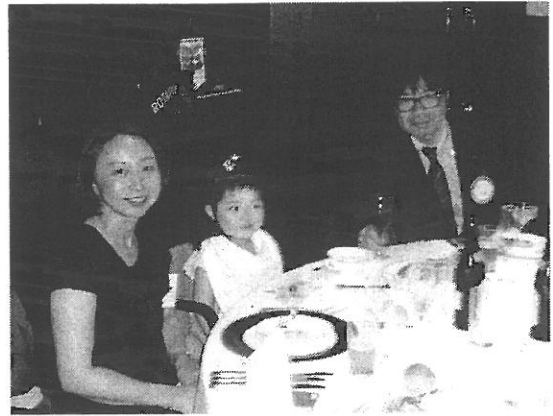
荒木会員ファミリー