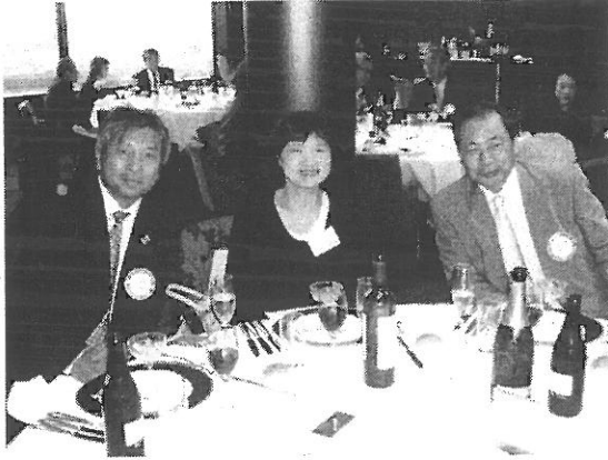
山下会長夫妻と河島幹事 1年間お疲れ様でした