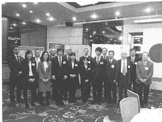
グリーンRC&RACファミリーで