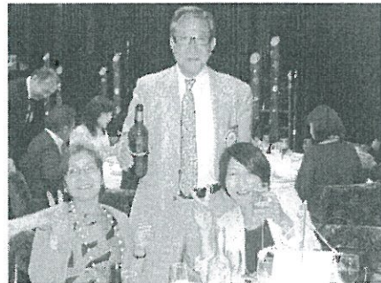
左から 松村夫人、上田会員、福島会員