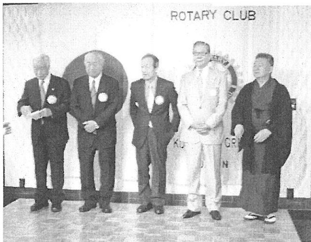
今年年祝いの5名 おめでとうございます