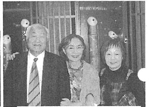
栗山夫妻と葉夫人