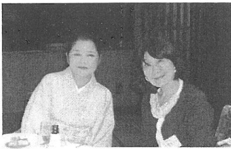
左から河野夫人、上田夫人