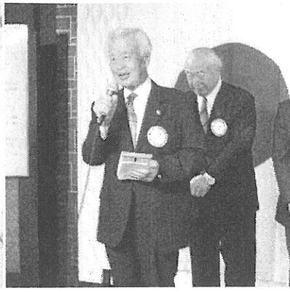
傘寿 葉 高源会員