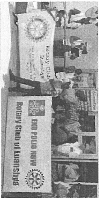
ルアンシャヤ・ロータリークラブ(ザンビア)が市民会館前にスロープを設置。

「半年もしないうちにクラブの会員数は4倍にふくれありました。1日で13名も入会したんです」