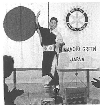
キンキラ劇団の方が踊りも披露