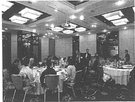
創立28周年記念例会の様子