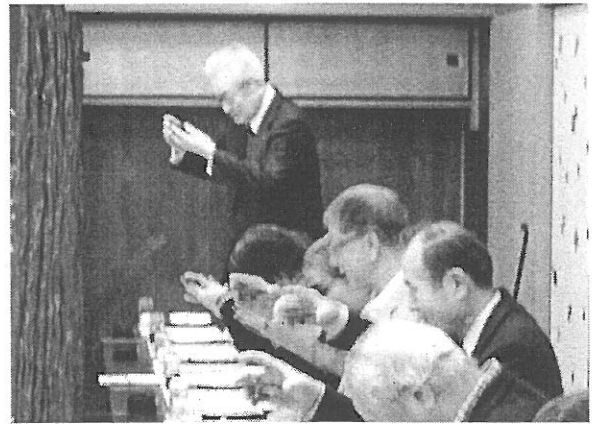
桜の花びら入り盃で乾杯！