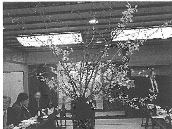
立派な桜を飾って頂きました