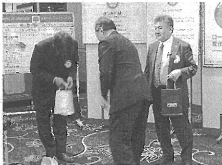
Happy Birthday, dear fellows!