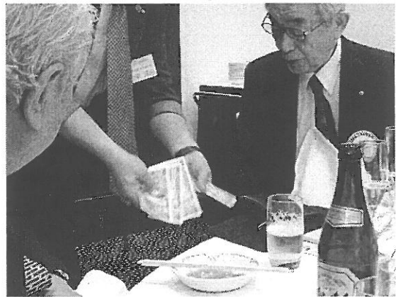
千円札の束が一瞬で一万円の束に？ 十時会員がびっくりされてました！