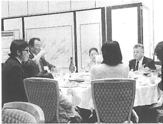
創立29周年記念例会の様子