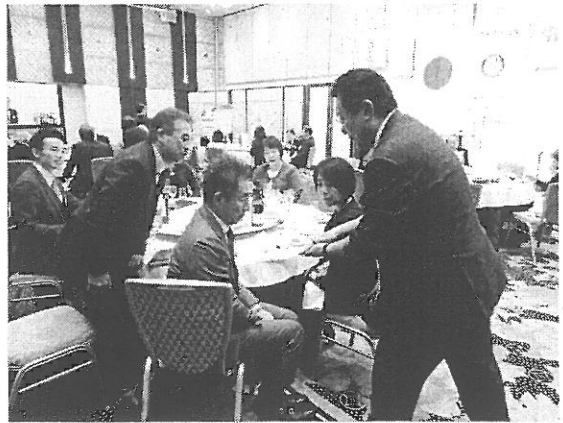
創立29周年記念例会の様子