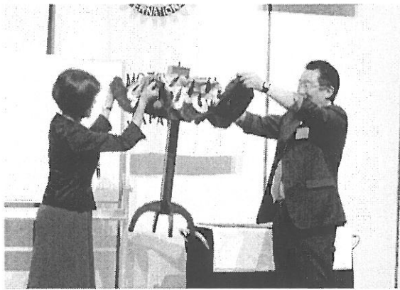
マジックショー テーブルが浮いてます！？