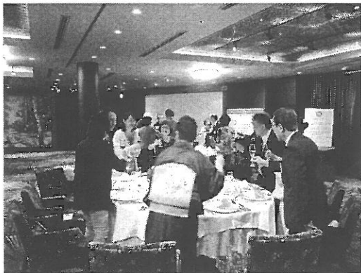
皆でグラスを合わせて乾杯!