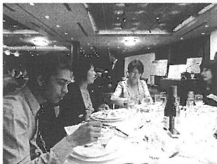
米山奨学生のゴバル君も初参加