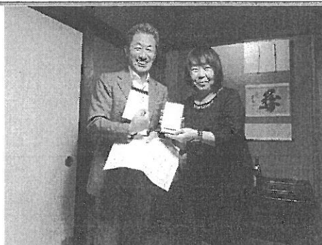
熊本中央RCチャリティーゴルフの景品贈呈