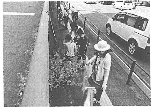
本田会長の子ども達も 清掃をがんばりました