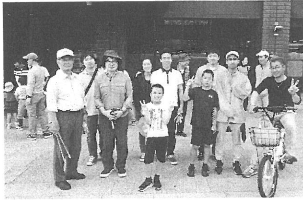
グリーンRC参加者 GWにもかかわらず多数のご参加 ありがとうございました