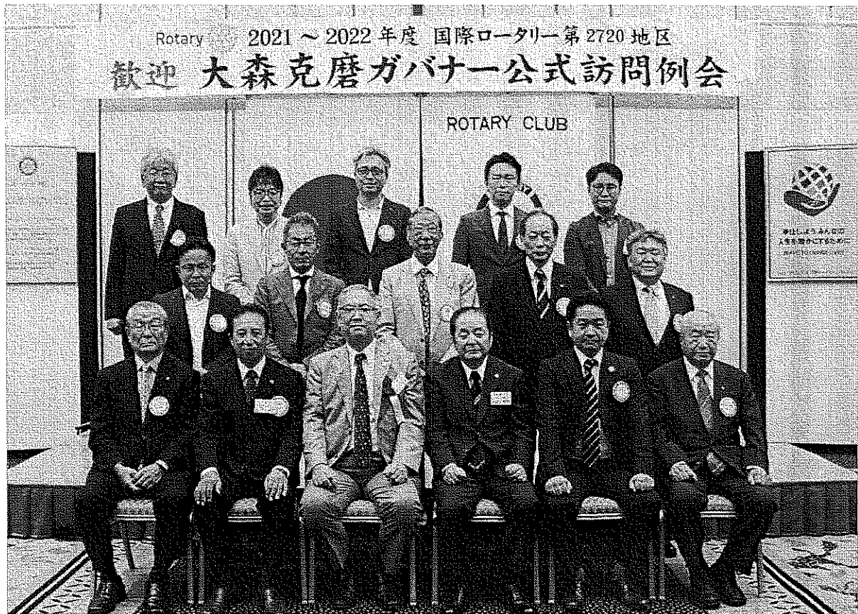
大森克磨ガバナー公式訪問集合写真 令和3年9月13日