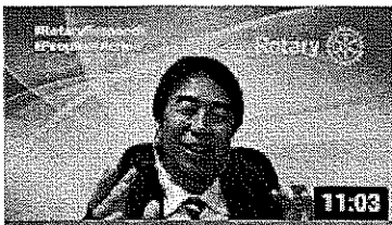
クラブ国際奉仕プロジェクトの懸け橋となる米山学友