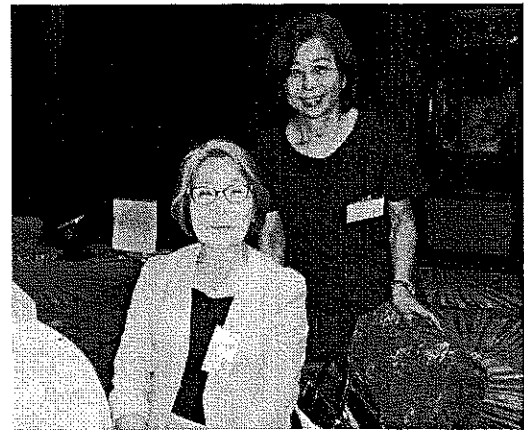
松村夫人と江上夫人