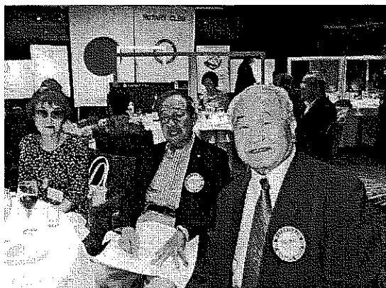
大友ご夫妻と栗山会員