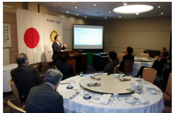
嘉悦雅文会員の自己紹介と保険のお話